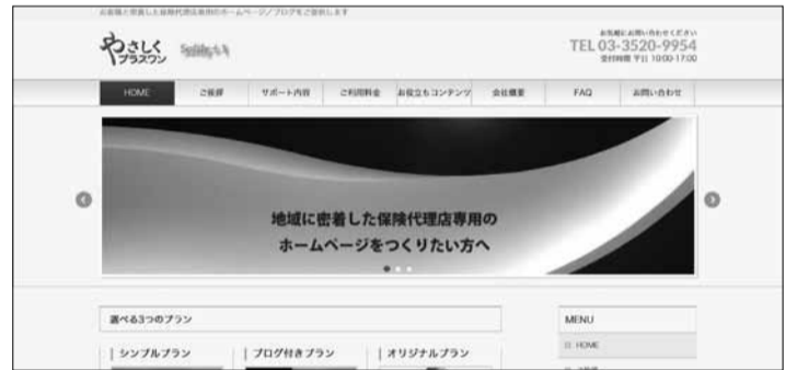
「やさしくプラスワン」のウェブサイト

後にはウェブサイトを通じた保険代理店の存在が見える化と、顧客や地域に役立つ情報の発信が重要になる。当社のウェブサイトをオリジナルプランの事例として参考にしてもらいたい」と述べる。